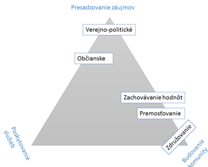
Obrázok 2 Typológia funkcií MNO